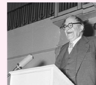
Karl Barth, um 1956

Der ev.-reformierte Theologe Karl Barth (1886-1968) kämpfte gegen einen politischen Missbrauch der Theologie - gegen eine Kirche, die im 1. Weltkrieg die Waffen segnete. Dieses ethische Versagen ließ den streitbaren Schweizer an den Grundlagen der liberalen Theologie seiner Zeit zweifeln. Gott lässt sich nicht für unsere Wünsche und Interessen vereinnahmen. Der in der Bibel bezeugte Gott ist ein ganz Anderer. Zugleich engagierte sich Barth auch leidenschaftlich politisch, so im Kampf gegen Hitler, gegen die Wiederaufrüstung der Bundesrepublik und im Ost-West-Konflikt. Am 10. Dezember 1968, vor gut 50 Jahren, starb der „Kirchenvater des 20. Jahrhunderts“ in Basel. Reformierte und Lutheraner erinnern 2019 an ihn mit einem Karl-Barth-Jahr.