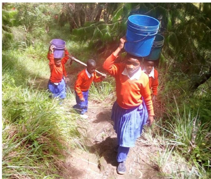
Schulkinder holen Trinkwasser von der Quelle

Anfang Oktober steht unsere nächste Reise nach Tansania an, die Vorbereitungen laufen auf Hochtouren. Wir werden eine Woche bei unseren Partnern in Lupombwe sein. Dort möchten wir erneut Augen-Screenings in den Grundschulen durchführen, um Kindern mit Sehschwäche eine neue Brille zu ermöglichen. Dies ist wichtig, da die Betroffenen häufig wegen ihrer Sehschwäche nur eingeschränkt am Unterricht teilnehmen können. Dieses Verhalten wird dann fälschlicherweise auf mangelnde Intelligenz oder Arbeitsverweigerung zurückgeführt.