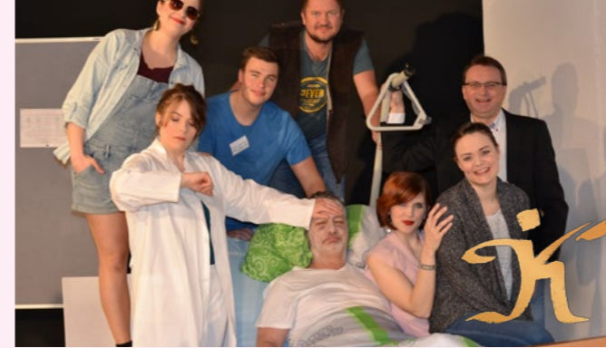
Szene aus dem Stück „Lieben, Leben und Sterben“

Seit 2014 gibt es den Verein „Kesselhaus Theater“, ein Ensemble aus rund 15 Laiendarstellerinnen und -darstellern, die regelmäßig in der Langenhorner Fritz-Schumacher-Schule proben und auftreten. Im vergangenen Jahr haben zehn Mitglieder der Truppe ihr erstes eigenes Stück geschrieben und inszeniert: „Lieben, Leben und Sterben“. Im Mittelpunkt steht Albert Bachmann, Anfang 60. Er ist unheilbar krank und hat, so die Diagnose seiner Ärzte, nur noch wenige Wochen zu leben. Albert ist alleinstehend und entschließt sich, in ein Hospiz zu gehen. Doch seine beiden erwachsenen Töchter begleiten ihn und sogar seine Ex-Frau steht ihm in den schwersten Stunden seines Lebens bei. Und da ist auch der Pfleger Max, der für Albert immer ein offenes Ohr hat. Im Hospiz blickt Albert auf sein Leben zurück, die besonderen Momente und