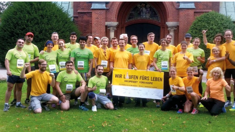
Ziel erreicht: Läuferinnen und Läufer für Hospiz und Runden Tisch