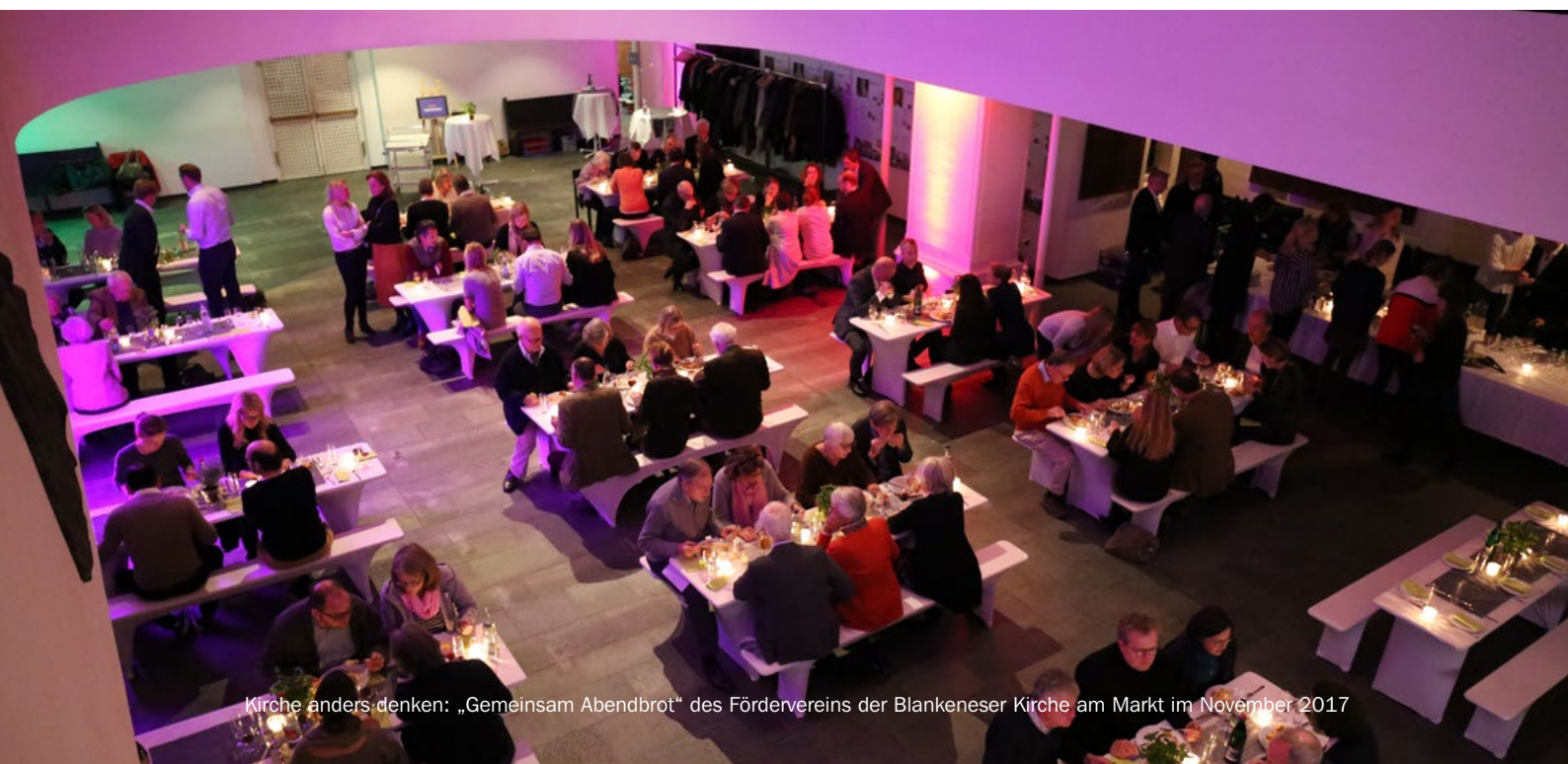
Kirche anders denken: „Gemeinsam Abendbrot“ des Fördervereins der Blankeneser Kirche am Markt im November 2017