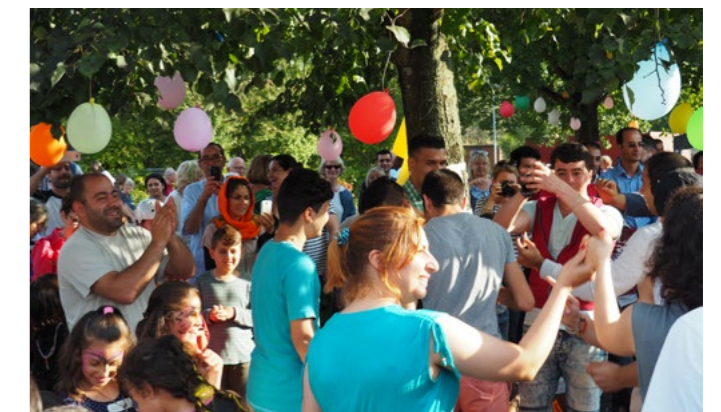
Sommerfest in Sieversstücken