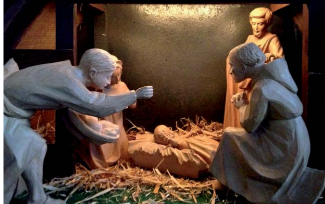
Krippe in der Kirche

Dormienstraße 9, 22587 Hamburg, Tel. 8660610, info@seemannsoehne.de, www.seemannsoehne.de