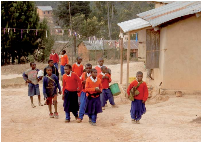
Marafiki-Patenkinder in Lupombwe, fotografiert während der Tansaniareise im Oktober 2015