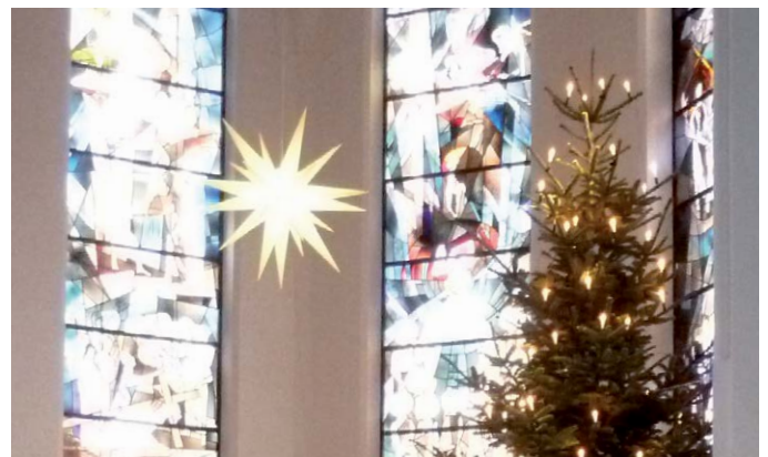
Herrnhuter Stern in der Blankeneser Kirche

Nach langer Zeit möchten wir wieder eine Taizé-Andacht in der Kirche feiern. Wir laden alle ein, die neugierig sind auf einen meditativen Gottesdienst mit biblischen Texten, Stille und vor allem vielen Taizé-Liedern. Einsingen der Gesänge ab 18.30 Uhr.