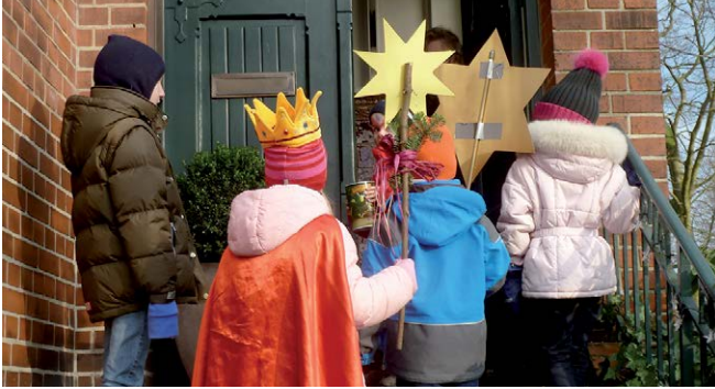
20+C+M+B+15: Sternsinger überbringen Segensgruß