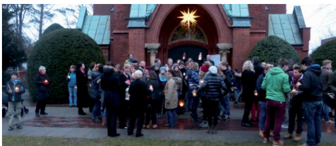
Das Bethlehem-Licht wird aus der Kirche in den Ort getragen

Eintritt frei, Spenden erbeten | Info: www.gospel-blankenese.de